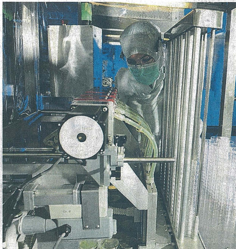
250 salariés à Combourg, les investissements prévus devraient permettre d'en embaucher une cinquantaine de plus.

AES Labo : 560 salariés, dont 250 à Combourg (un effectif qui a doublé en dix ans), 70 millions d'euros de chiffre d'affaires. Six filiales à l'étranger, 70 distributeurs dans le monde entier. Bruz accueille les services administratif, commercial, marketing, après-vente et la direction. Combourg gère une partie de la production et toute la logistique.